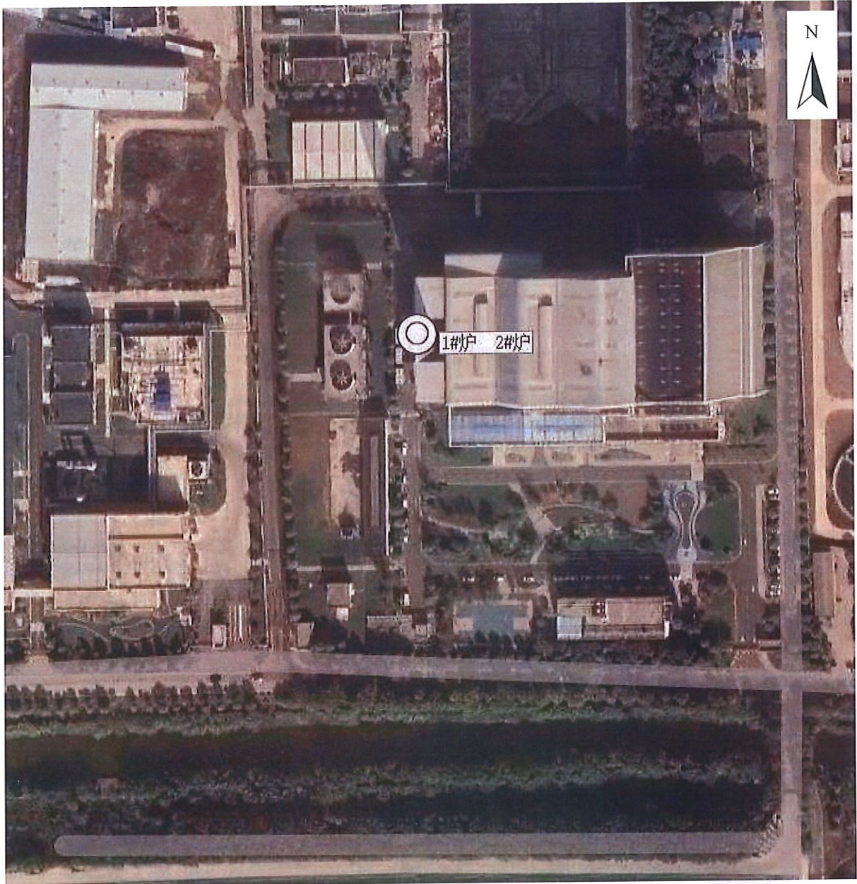
附图 1：监测点位示意图